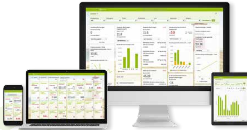
Benutzeroberfläche der Browserintegrierten Systemdarstellung (SAP Fiori-Launchpad)

Schaffen Sie sich also nun mit SAP S/4HANA eine solide Basis auf der Sie aufbauen können, um in der digitalen und vernetzten Zukunft erfolgreich zu sein. Die optimierten Geschäfts- prozesse und die innovative Technologie des Produkts bereitet Sie auf diese Herausforderung vor.