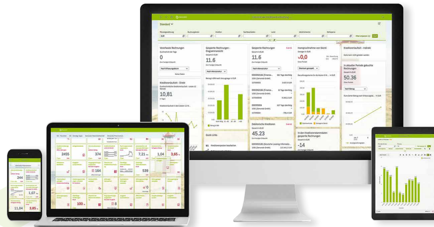
Benutzeroberfläche der Browserintegrierten Systemdarstellung (SAP Fiori-Launchpad)

Schaffen Sie sich also nun mit SAP S/4HANA eine solide Basis auf der Sie aufbauen können, um in der digitalen und vernetzten Zukunft erfolgreich zu sein. Die optimierten Geschäftsprozesse und die innovative Technologie des Produkts bereitet Sie auf diese Herausforderung vor.